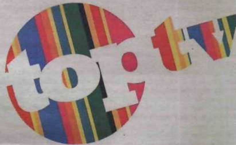
TopTV, wat in Mei bekend gestel word, se handelsmerk.

Govender sê dit het R80 miljoen gekos om ODM van niks af te bring